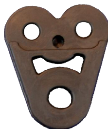
14327 Merc. Gummihängen