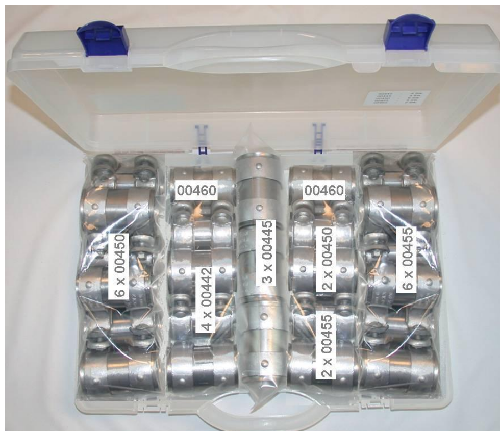
intec 99830 KICO-Rohrverbinder-Koffer

Zur Markteinführung der neuen KICO-Rohrverbinder, haben wir einen Aktionskoffer mit folgender Zusammensetzung aufgelegt: