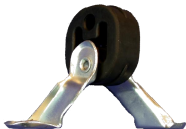
11343 VAG Gummimetallhalter

Die nachfolgenden Teile haben wir in den vergangenen Wochen zu unserem ab Lager lieferbaren Programm hinzugefügt: