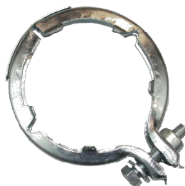
97127 Merc. Schelle 90mm