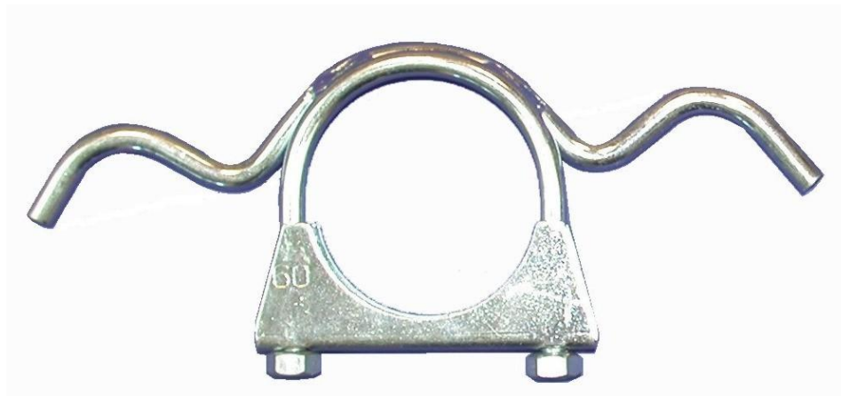
55460 Volvo-Bügel mit Aufhängung