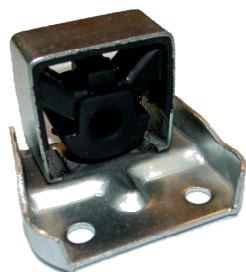
75323 Niss. Gummimetallhalter