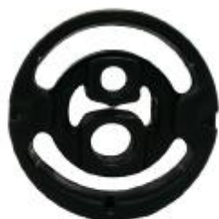
21311 Citroen Gummi- Metallpuffer