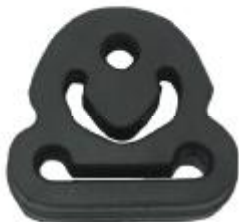
75317 Nissan Gummihalter