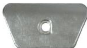
10502 BMW Halteblech