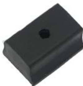
77319 Toyo Gummi