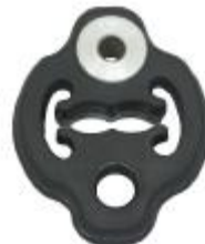
75322 Nissan Gummihänger mit großer Hülse