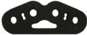
33324 Fiat Gummihänger