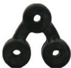
87304 Daewoo Gummihänger