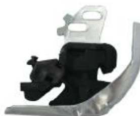
22331 Renault Gummi- Metallhalter Langlöcher