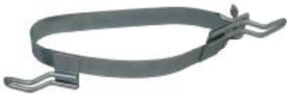
55402 Volvo Topfhalter