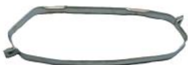
10440 MINI Topfhalter