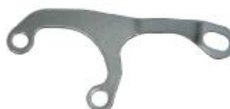
10506 BMW Verbindungsblech