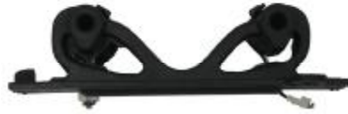
33331 Fiat Gummihalter