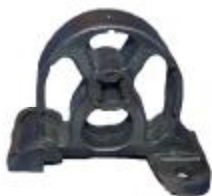
10336 BMW Gummi- Metall- Hänger

Die nachfolgenden Teile haben wir in den vergangenen Wochen zu unserem ab Lager lieferbaren Programm hinzugefügt: