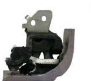
22332 Renault Gummi- Metallhalter Rundlöcher