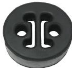
77314 Toyo Gummihänger