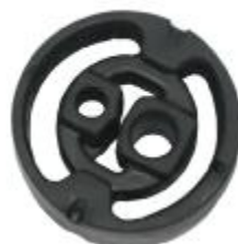
21310 Citroen Gummi- Metallpuffer