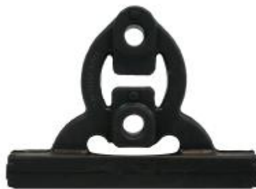
71307 Daihatsu Gummihänger