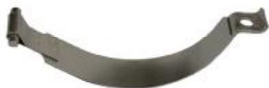
11408 VAG Topfhalter