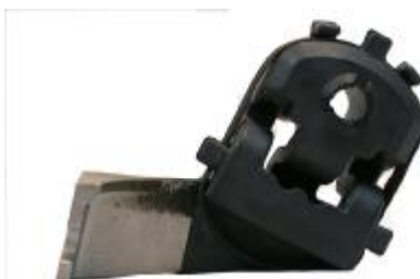
23324 Peugeot Gummi- Metallhänger